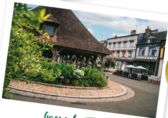
Lions-la-Forêt Eure - 750 habitants