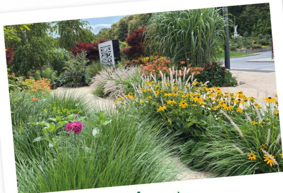
Changé Mayenne - 6020 habitants

La fleur d’or est attribuée chaque année à un nombre restreint de communes déjà labellisées 4 fleurs, qui présentent une démarche exemplaire . Elle est valable 1 an et ne peut être remise en jeu que tous les 6 ans. Six communes décrochent le titre cette année :