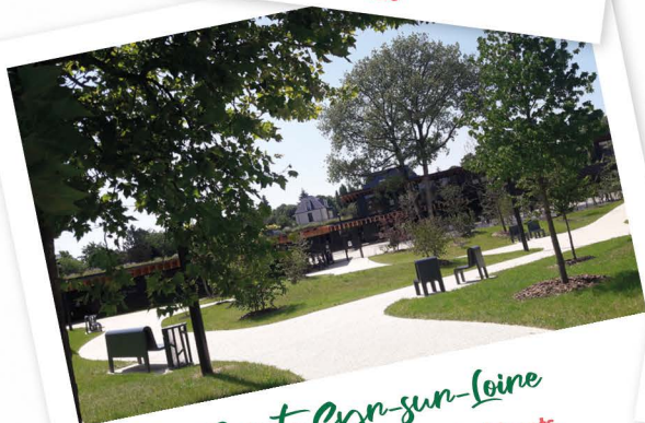
Saint-Cyr-sur-Loire Indre-et-Loire - 16 627 habitants