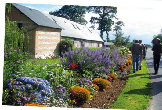
Les Hauts-de-Caux Seine-Maritime - 1365 habitants