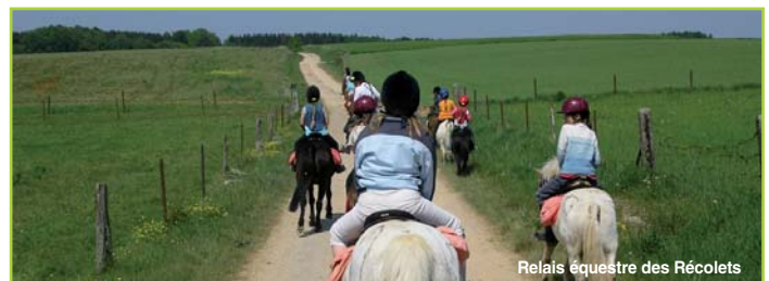
Relais équestre des Récolets